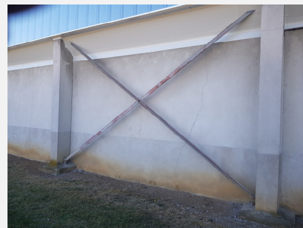
Repérage des encombrements et visuel sur EP