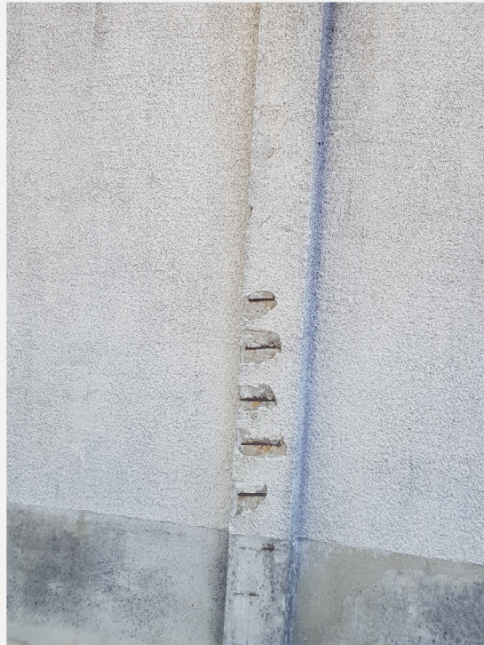
Etat général des armatures en pignons