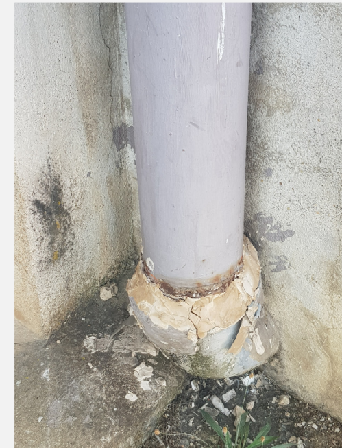
Reprise de regard et pied de descente d'eau pluviale