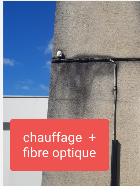
Réseaux en façade