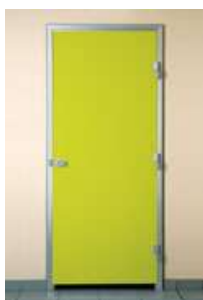
Type de porte pour les douches.