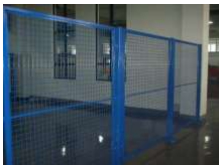
Type de cloison souhaité.