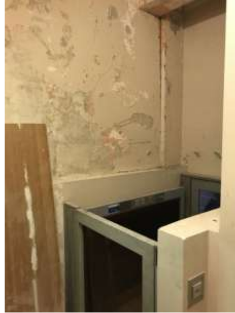
Local Monte personne