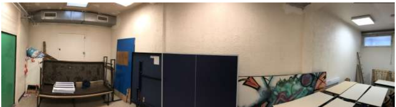
Salle de projections