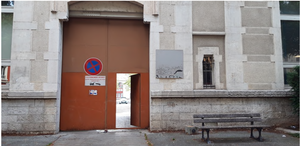
Figure 1Portail BD Gambetta