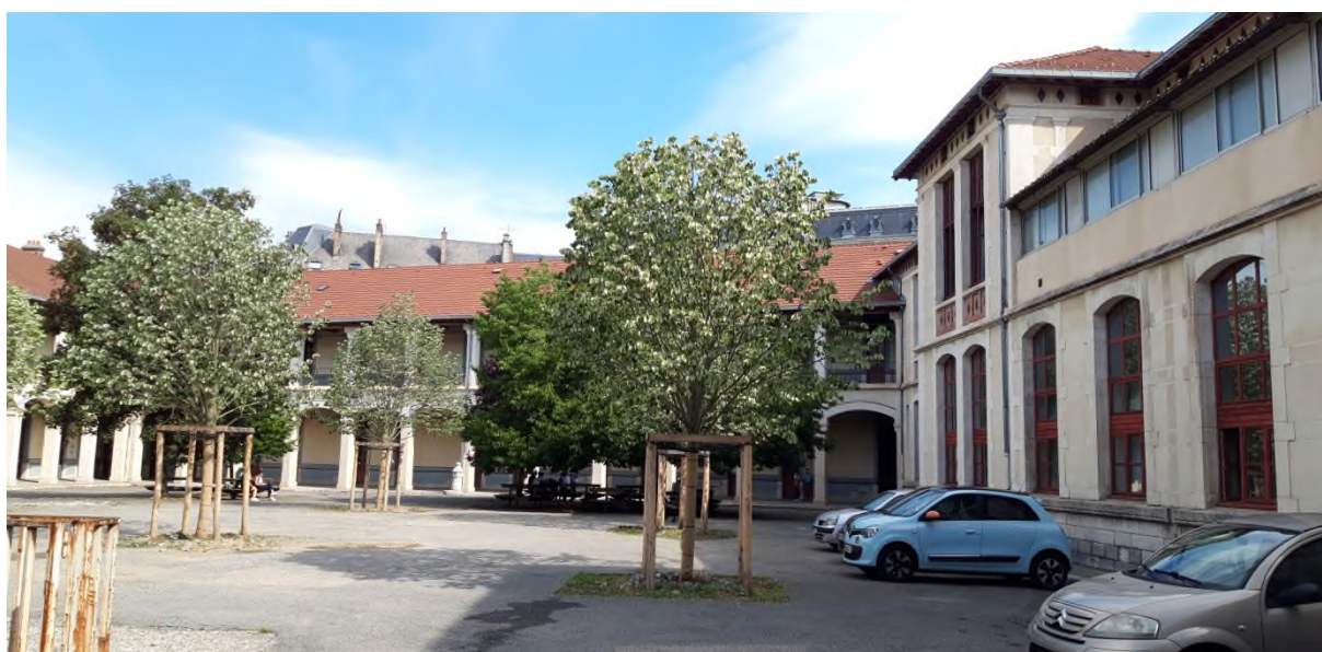
Figure 3 Cour A à droite : A/H, de face A/Lafontaine