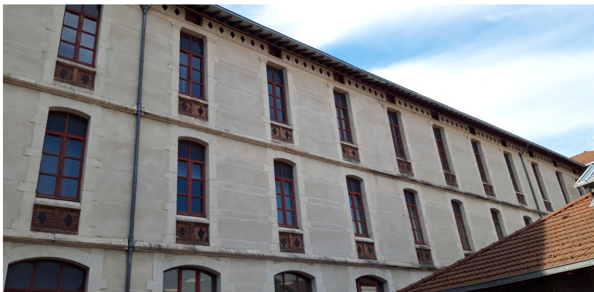
Figure 2 Bâtiment A/B