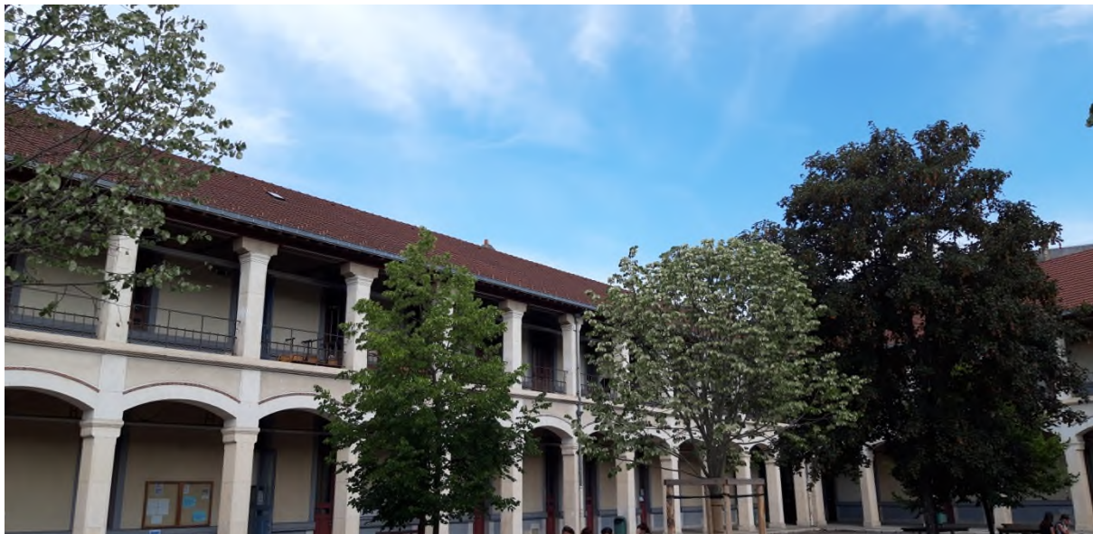
Figure 4 cour A, A/Gambetta