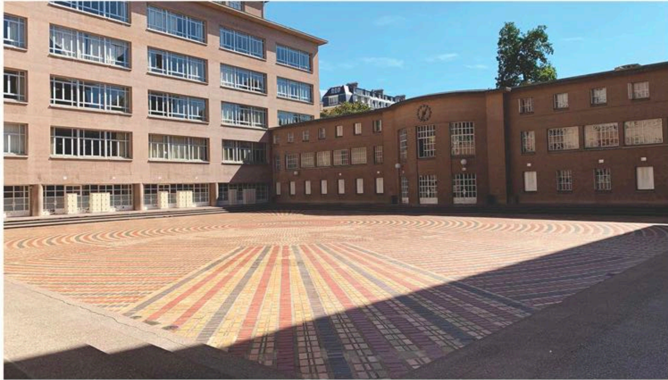
ETAT DES LIEUX