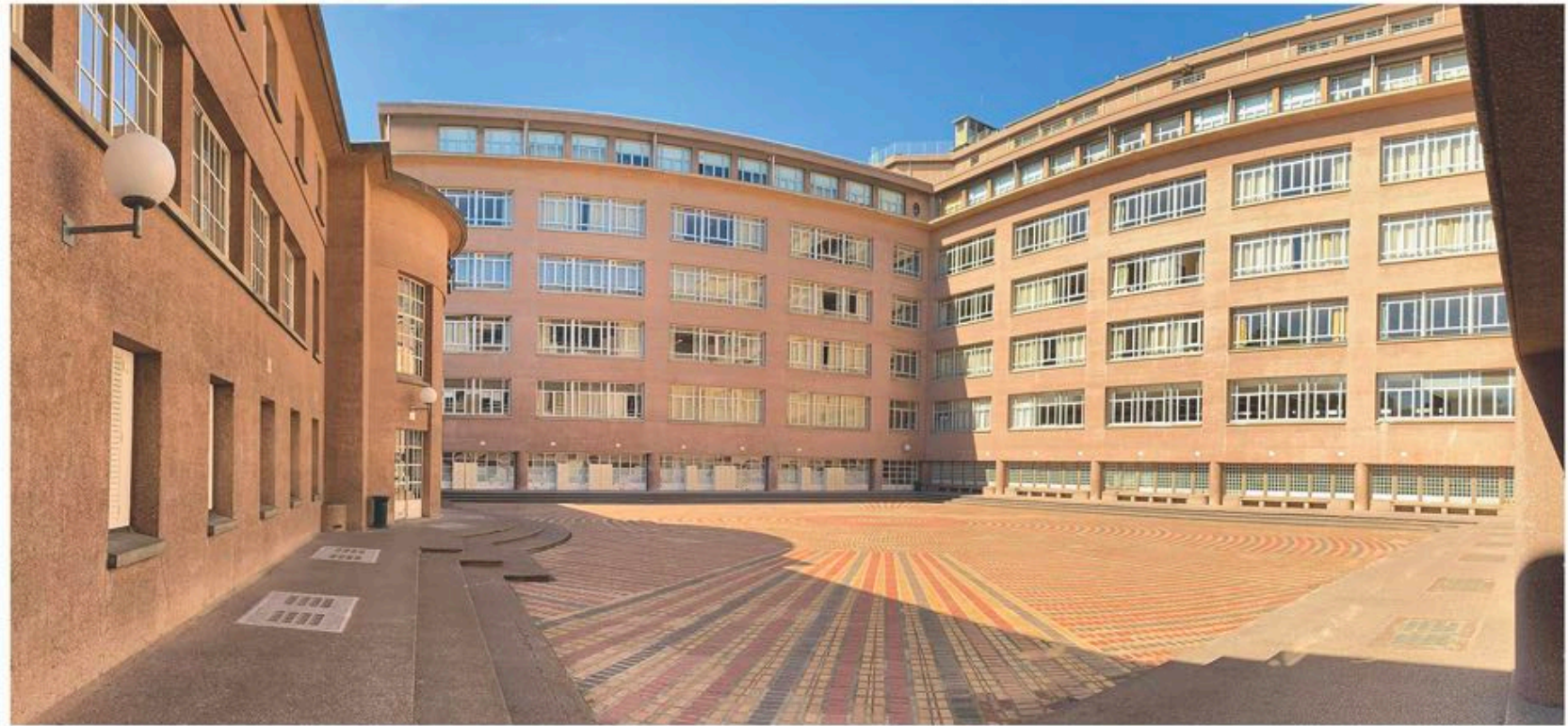
ETAT DES LIEUX