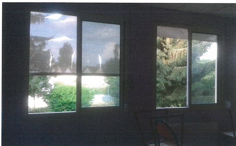
Photo – Salle type à équiper de rideaux

Les dimensions des rideaux posées dans les salles 103, 209 et 215 sont les suivantes : L1600 H1650.