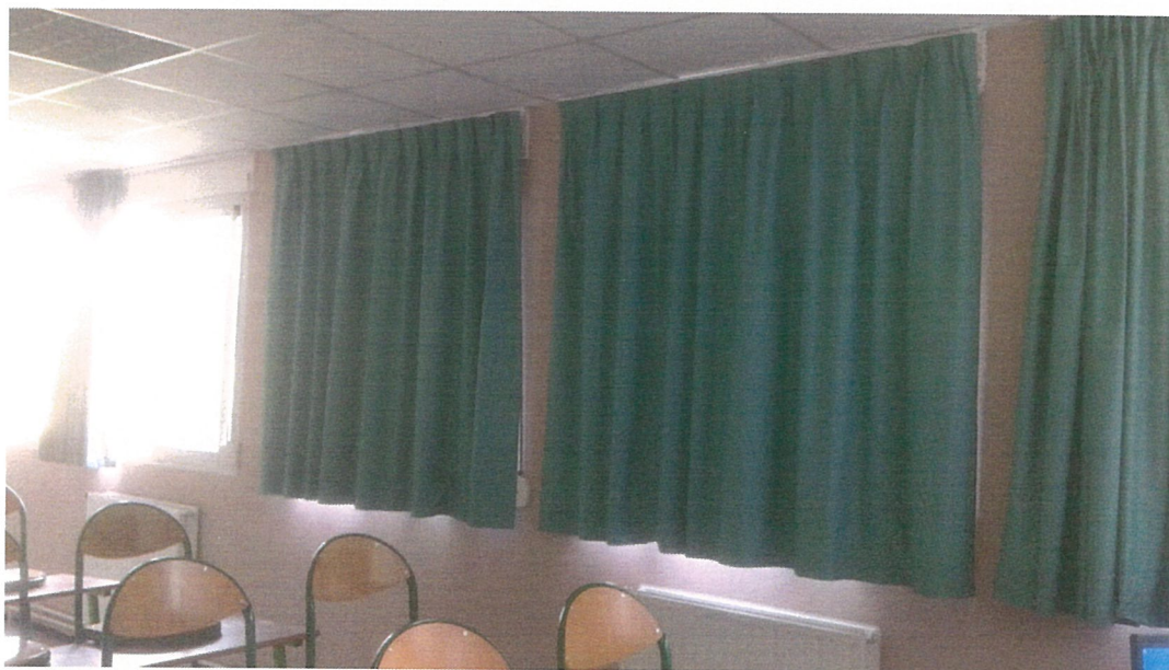
Photo – Rideaux de la salle 103

Le collège Arthur Chaussy envisage d'équiper en rideaux occultant les salles de classe du premier et du deuxième étage, côté francilienne (exposition ouest) du bâtiment dit « externat » en respectant scrupuleusement les installations techniques déjà réalisées dans les salles tests (n° 103, 209 & 215) dans un souci d'uniformité et d'harmonie.