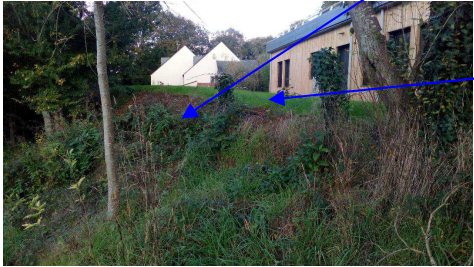
Absence de sécurisation du site et des accès aux bâtiments