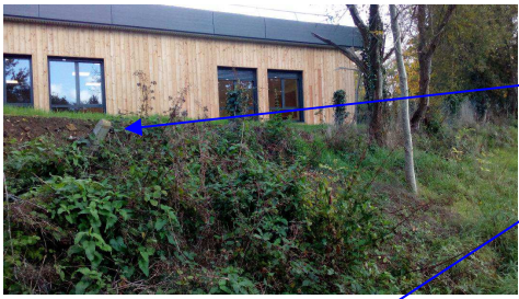
Restes d'un poteau de la clôture initiale