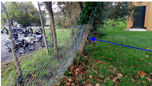
Perte de solidité et de stabilité / risque de chutes des poteaux et/ ou de personnes