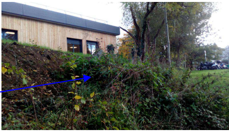
Disparition de la clôture initiale sous le remblai et les aménagements