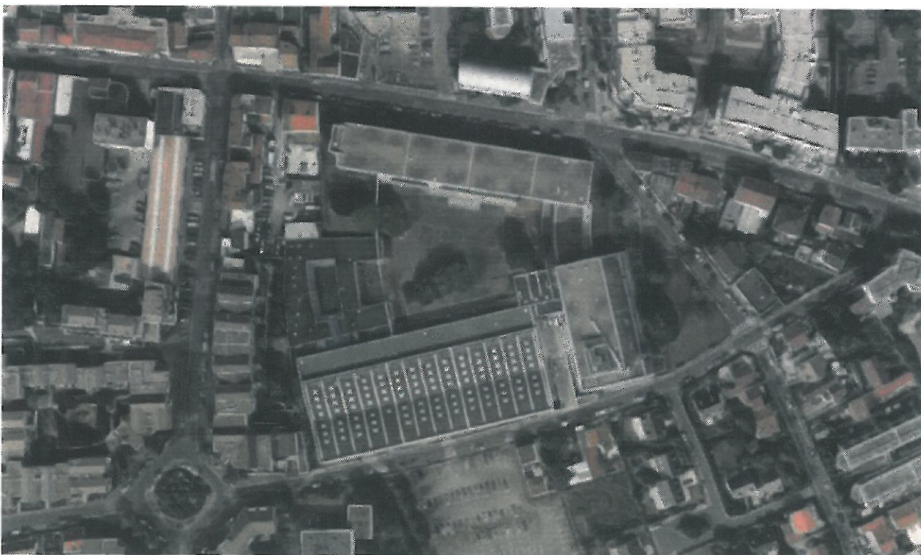
Photo aérienne de l'établissement

De plus, l'accès direct au hall se fait par les doubles portes situées à l'entrée de l'établissement. Ces portes se situent dans l'axe de l'accès au hall des élèves et également dans l'axe de l'accès à la cour du lycée. Les portes, toujours maintenu en position ouvertes pour des raisons évidentes de fonctionnement et de circulation créent une continuité favorisant les échanges thermiques avec l'extérieur, et plus particulièrement des déperditions thermiques importantes favorisant l'inconfort de cette partie du lycée, pourtant très fréquentée.