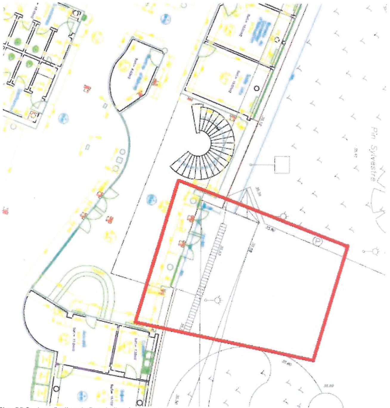
Plan RDC – Localisation du lieu de l'opération – Echelle graphique