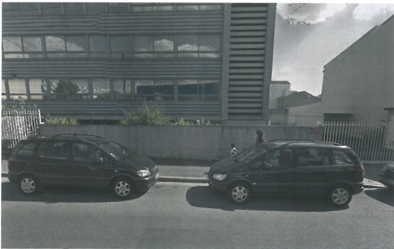
Vue d'une partie de la clôture maçonnée actuelle

L'opération consiste à la rehausse d'une hauteur d'un mètre de toutes les parties maçonnées qui composent la clôture périphérique de l'enceinte du lycée.