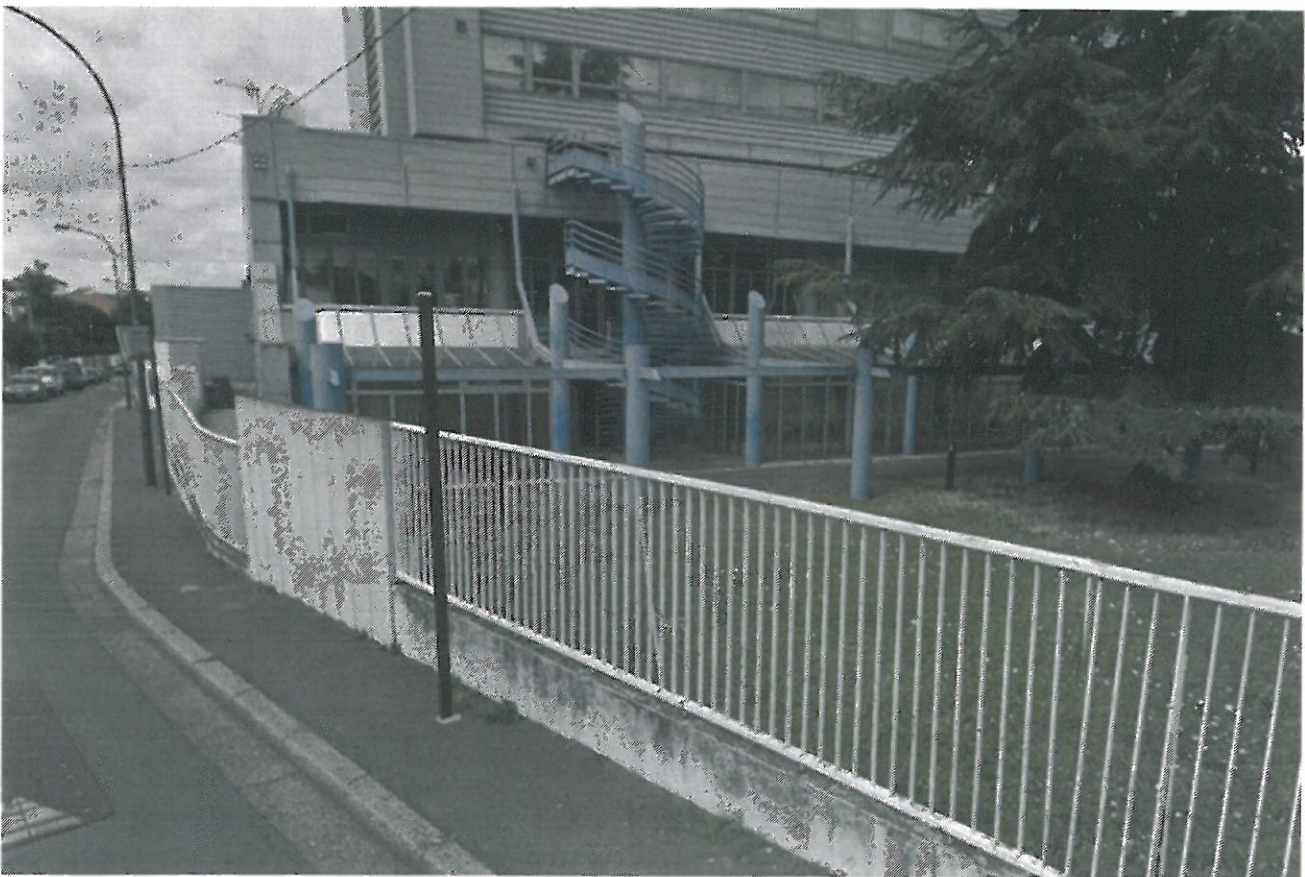
Vue de l'escalier depuis la rue du Prebuard

Le bâtiment I de l'établissement possède un escalier extérieur, issu de secours , accessible depuis la façade principale du bâtiment face à la rue Charles LECOQ, et qui permet un accès facile et rapide au premier étage du bâtiment, mais également à la toiture terrasse de ce dernier sans avoir à passer par l'accueil de l'établissement.